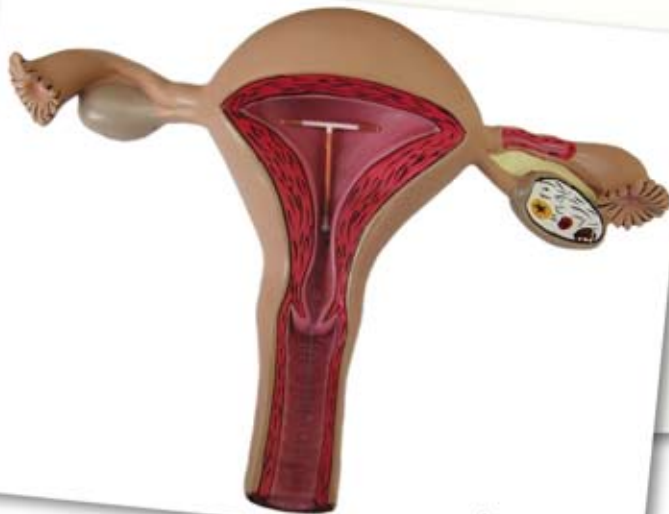
uterus met T-Safe